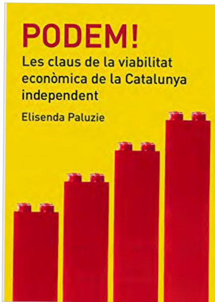
Imatge de Podem! Les claus de la viabilitat econòmica de la Catalunya independent d'Elisenda Paluzie.